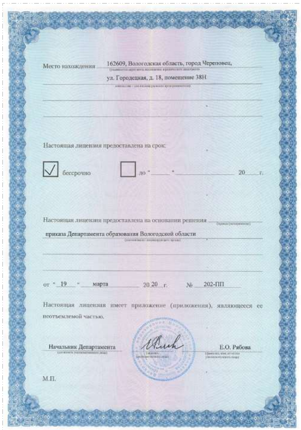
Лицензия (сторона Б)